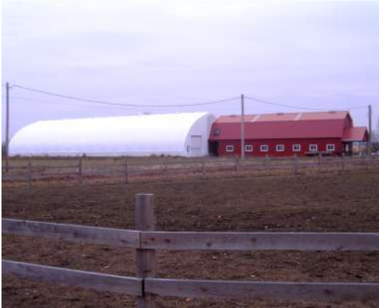
Visuel : Les Consultants Yves Choinière Inc.

Il est également important de s'assurer du champ de compétence des entrepreneurs engagés et de la validité de leurs assurances et de leurs permis. Lorsque vous aurez des contrats avec les divers entrepreneurs ou fournisseurs, vous serez considérés comme maître d'oeuvre. Vous devrez alors avoir une assurance de chantier et le chantier sera sous votre responsabilité. Avant d'effectuer le paiement de vos entrepreneurs, vous devez vous assurer que leurs sous-traitants ont été payés.